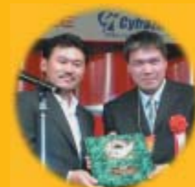
楽天市場2年連続(2003、2004年) ショップオブザイヤー受賞